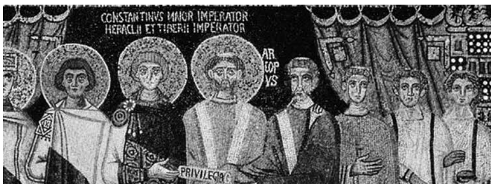
Сл. 8. Давање привилегија Равенској Цркви

На северном зиду олтарског дела 8 (сл. 8) имамо каснији приказ из времена цара Константина IV (цар 668–685), на којем цар дарује привилегије Цркви у Равени. Приказана су два епископа, иза њих презвитер, а иза њега два ђакона, приказана као и на мозаику цара Јустинијана. Свих пет набројаних фигура носе постриге типичне за свештенство.