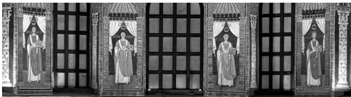
Сл. 7. Епископи Равенске Цркве

На северном зиду олтарског дела 8 (сл. 8) имамо каснији приказ из времена цара Константина IV (цар 668–685), на којем цар дарује привилегије Цркви у Равени. Приказана су два епископа, иза њих презвитер, а иза њега два ђакона, приказана као и на мозаику цара Јустинијана. Свих пет набројаних фигура носе постриге типичне за свештенство.