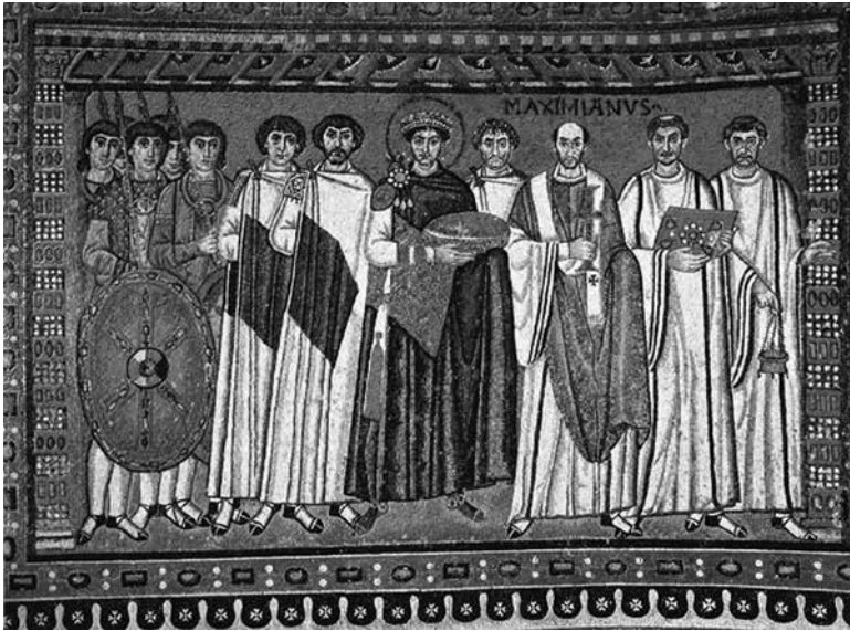
Сл. 5. Јустинијан и Максимијан Равенски са пратњама

Други равенски споменик Јустинијанове епохе је базилика Светога Аполинарија у Класи. Мозаици овог споменика очувани су у источном делу базилике.