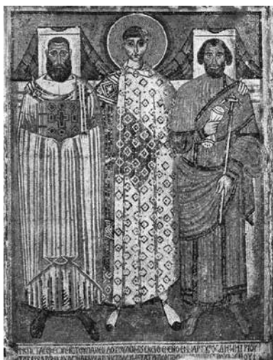
Сл. 2. Св. Димитрије са Јованом Солунским и епархом Леонтијем