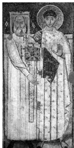
Сл. 3. Св. Димитрије са ђаконом