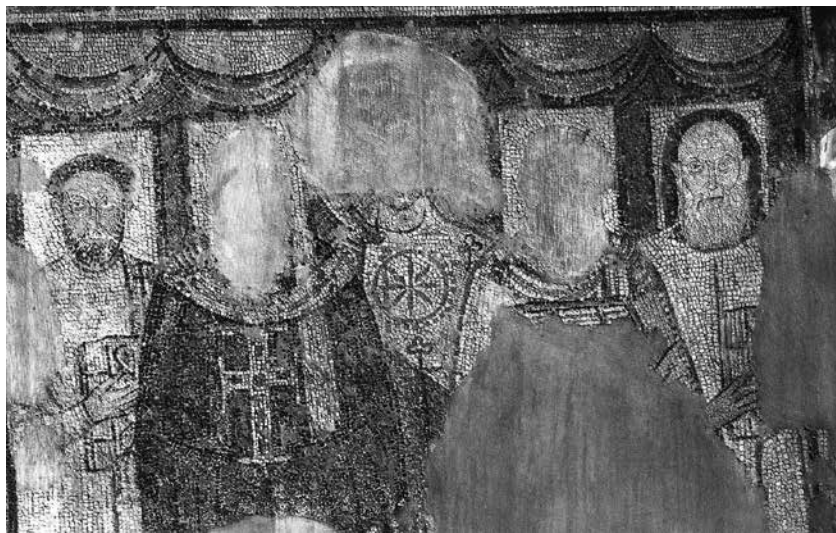
Сл. 1. Св. Димитрије са свештенством