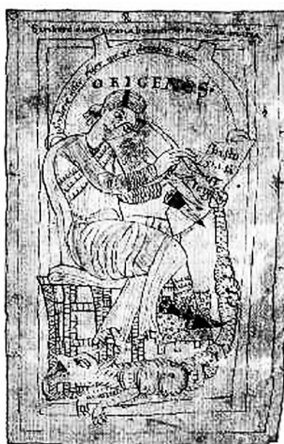
Ориген, средњовековна илустрација (Origenes, In Numeros homilia XXVII , Schäfflarn (c. 1160) [Bayrische Staatsbibliothek, München])